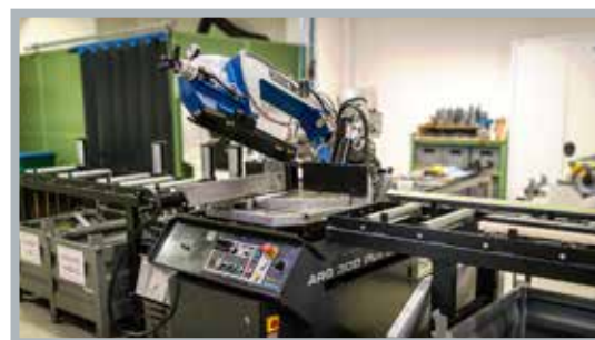
Pilous ARG 300 Plus S.A.F. fűrészgép