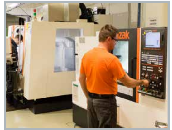
Alkatrészgyártó műhely, hajtott szerszámú CNC esztergával az előtérben, mögötte pedig a CNC megmunkálóközpont