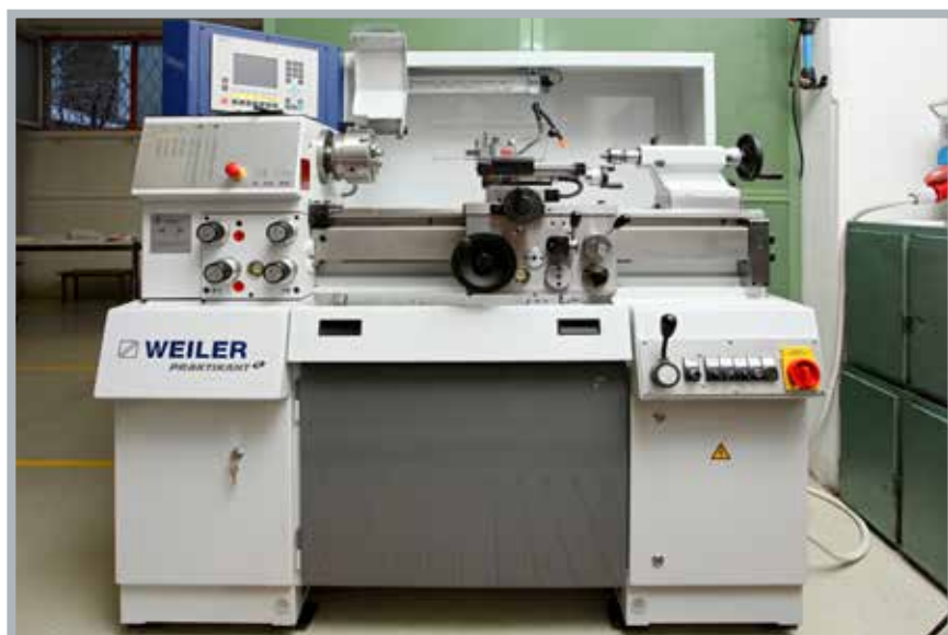
Weiler Praktikant VC precíziós csúcseszterga