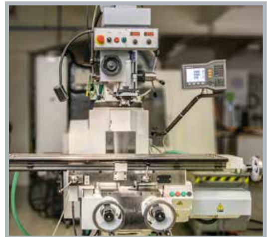
TOS FNK 2 R szerszám-konzolmarógép