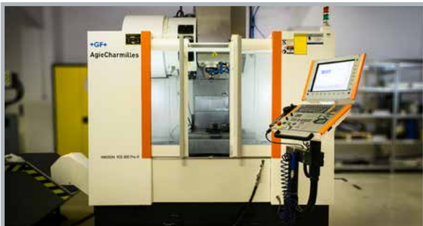
GF AgieCharmilles Mikron VCE800Pro-X CNC megmunkáló központ